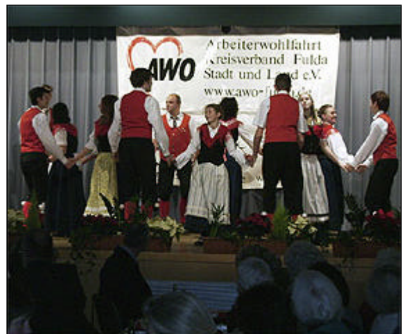
Die Volkstanzgruppe "Die Nässetaler"