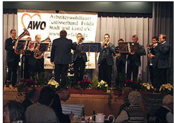
Der Musikverein "Lyra 1949" aus Kerzell

Eine Veröffentlichung der Inhalte bedarf der Zustimmung von Osthessen-News.